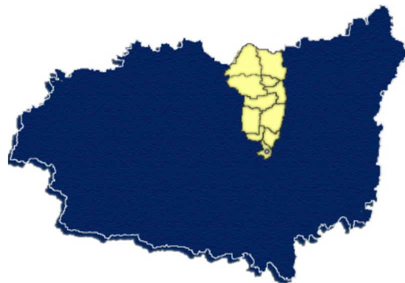
Area de influencia de la FHVLe en León

Ahora bien, no todos los municipios de la provincia, más de 200, sufren la influencia de las acciones y actividades desarrolladas por la Fundación Hullera Vasco Leonesa. De hecho únicamente 11 términos municipales se encuentran bajo esta influencia.